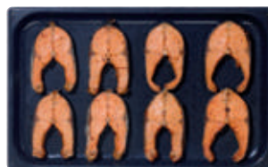
GN 1/1 поперечная загрузка

Ваше преимущество: большой плюс по загрузке - высокая производительность. Ускоряются все производственные процессы. Вы экономите не только рабочее время, но и ценную энергию.*