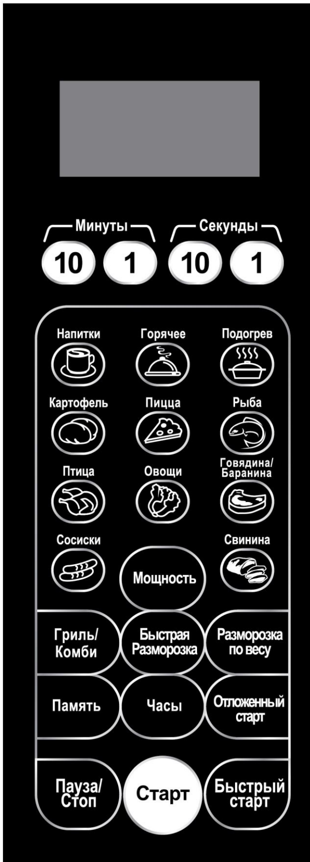
Рис.2. Панель управления оборудования